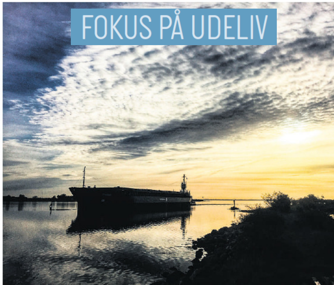
Vigelsø ligger ved indsejlingen til Odense Havn, så der kan komme nogle store gæster forbi.