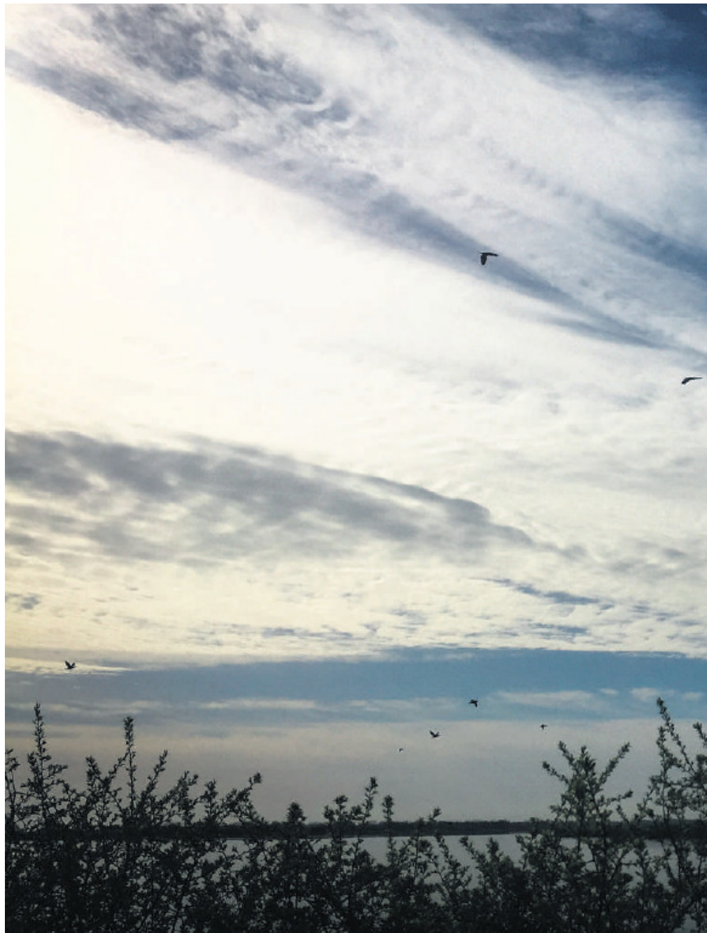
Fuglelivet på Vigelsø er i særklasse: Foto: Klaus Knakkegaard